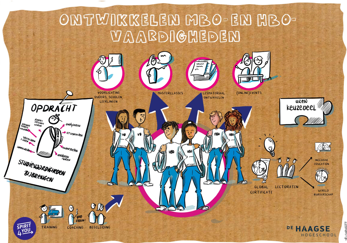
Het project in beeld

Student Skills Team – Spirit4you, studiejaar 2020/2021